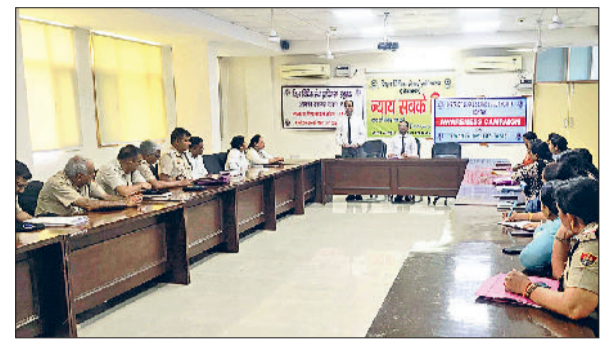
रोहतक। बीएमयू में आयोजित कार्यशाला में मौजूद शिक्षक व छात्र।